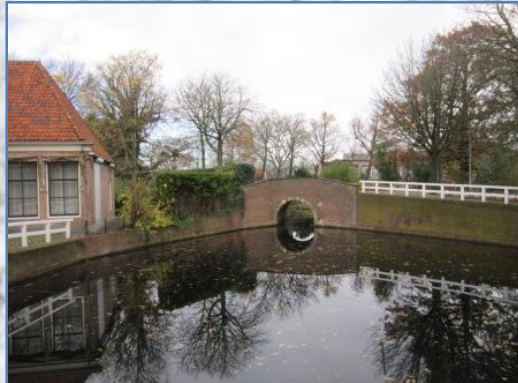
Prachtig uitzicht over de oude stad.