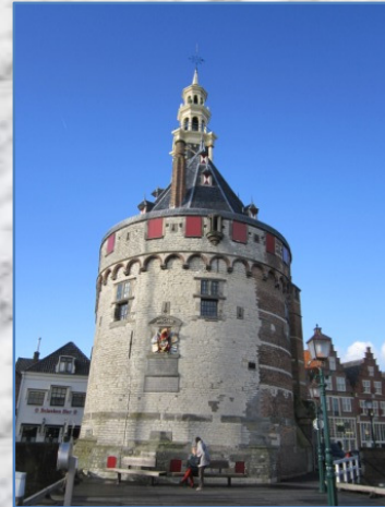
De Hoofdtoren (1532) & Het Houten Hoofd (1464)