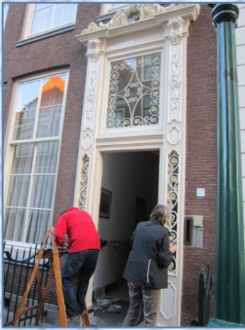
Inwoners aan het schilderen van hun huis, met goud.