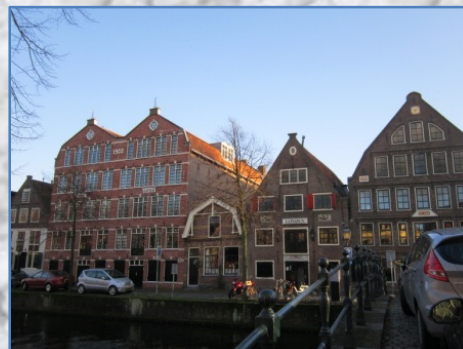
Pakhuizen van de Bierkade – Pakhuis London, Pakhuis Gouda en Alkmaar, pakhuis de Zon