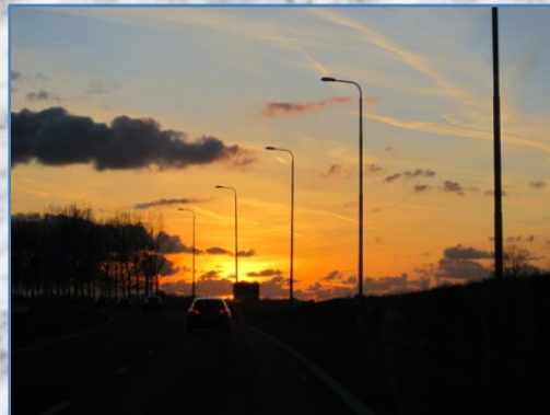
Geweldig eind van het dagje uit!