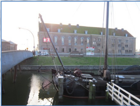
Museum van de 20 e eeuw