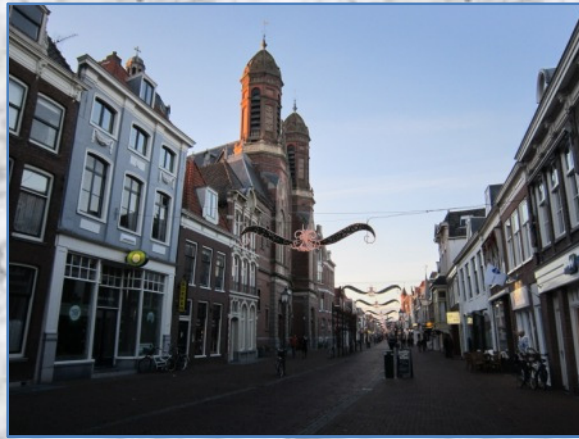
De Grote Noord winkelstraat (lijkt op de Alkmaarse Langestraat!)