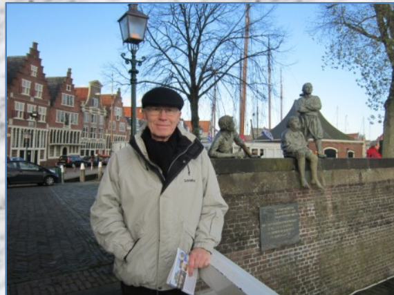
De Scheepjongens van Bontekoe

U kunt een 17 e eeuwse stripverhaal zien op de gevel in deze drie huizen. Het verhaal van de slag op de Zuiderzee .