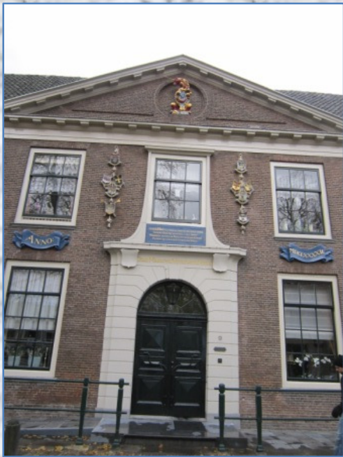
Het Sint Pietershof

In de 15 e eeuw werd hier het klooster der Kruisherenbroeders gesticht, dat in 1577 in gebruik genomen werd als oudemannahuis . Vanaf 1844 deed een deel van het pand dienst als dolhuis en gevangenis .