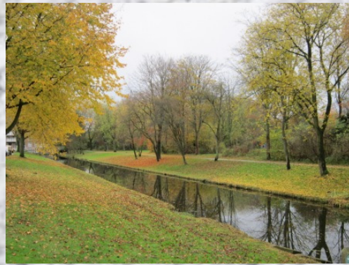
Mooi uitzicht in Alkmaar voor wij vertrokken.