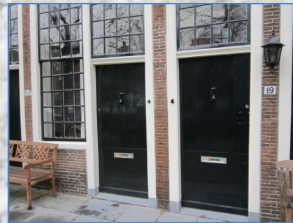
Het Claes Stapelhofje

Dit hofje is in 1682 door Claes Stapel en 2 van zijn vrienden gesticht. Het is een voormalig vrouwenhofje maar is nu voor dames die oud noch behoeftig zijn.