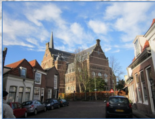
Ooster – of Sint Anthoniskerk

In de Kerk zijn tegenwoordig winkels en appartementen ondergebracht.