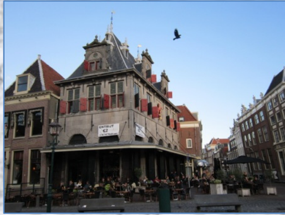
De Waag (ontworpen door bouwmeester Hendrick de Keyser)