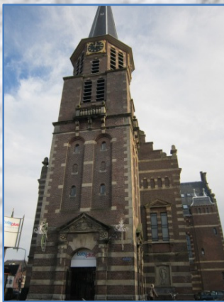
De Grote Kerk

1) Het Admiraliteitspoortje ; 2) het Kloosterpoortje ( PpP=Pugno pro Patria- 'ik vecht voor het vaderland' )