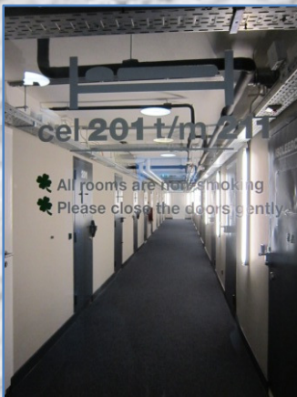
Hotelkamers (vormalige gevangenis kamers)