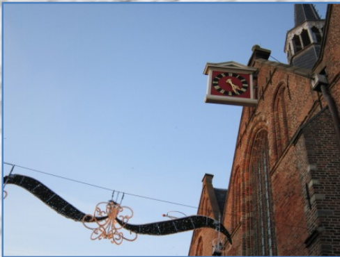
De Noorder- of OLV-kerk (1426)-de enige die uit de Middeleeuwen dateert.