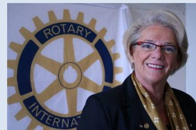
Addy Goudsmits, Gouverneur