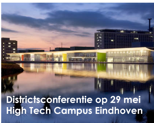
Districtsconferentie op 29 mei High Tech Campus Eindhoven

Districtsconferentie 29 mei a.s. op een schitterende locatie : de High Tech Campus, Eindhoven' s trots!