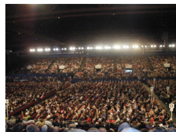
Birmingham: "The family of Rotary"