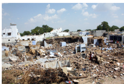
Huis en familie verdwenen