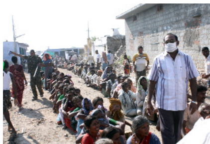
Wachten - honger