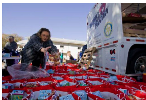
Zomaar een dag in de week ....