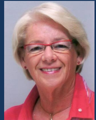
Addy Goudsmits Gouverneur District 1550