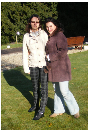
Twee meiden uit Timisoara, Roemenië, die erg dankbaar waren nadat ze de mogelijkheid hadden gehad om te kijken in de Nederlandse "keukens" van bedrijven.

Het is mooi om jonge mensen te kunnen helpen, overigens ook in onze eigen omgeving. Ik spreek veel met enthousiaste, net in hun werk startende jong volwassenen, als ze iets willen weten over mijn vak of over het starten van een onderneming. En ook die kennis kan ik weer gebruiken met NGE."