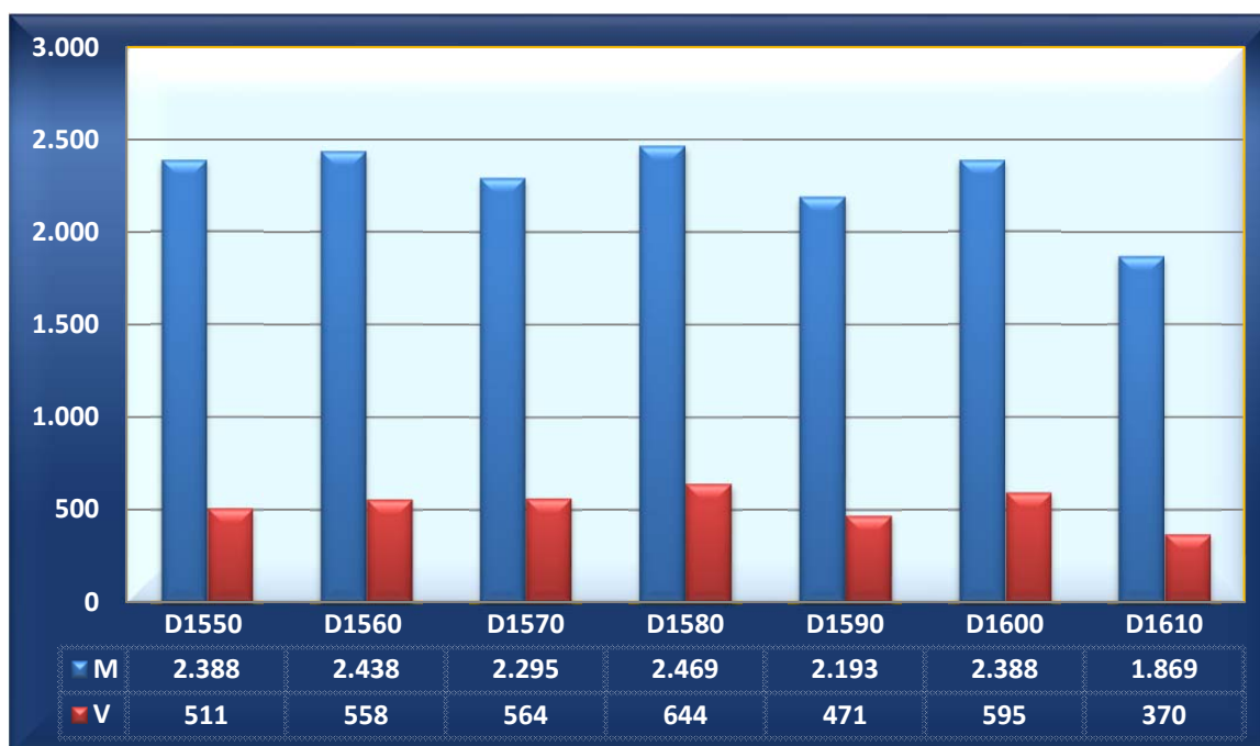
Grafiek verdeling (m/v) per district