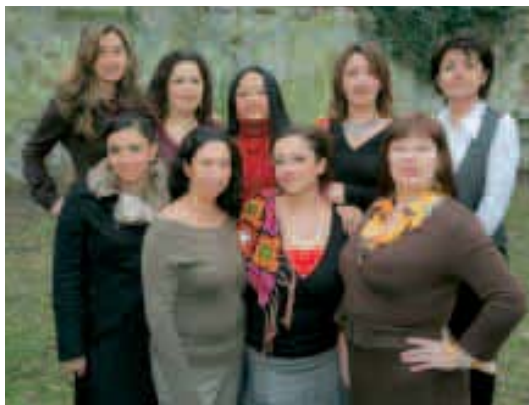
Negen van de dertien vrouwen die aan Parels meewerkten.