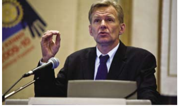
Jan Egeland, VN vredesactivist, spreekt op het Rotary World Peace Symposium in 2009

'We leven in een van de meest vreedzame tijden,' zegt Egeland in een toespraak voor rotarians en alumni van het Rotary World Peace Fellowships programma op de Rotary World Peace Symposium in Birmingham, Engeland in 2009. Hij duidt daarmee aan