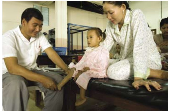
Rotary steunt projecten voor hulp aan slachtoffers van landmijnen in Cambodja

Mine-Ex is een liefdadigheidsfonds van district 1980, 1990, en 2000, (Zwitserland, Liechtenstein) dat werd opgezet in 1994 nadat wijlen chirurg Hans Stirnemann (RC Burgdorf) terugkeerde van een driejarig verblijf in Zuidoost Azië waar hij slachtoffers van landmijnen behandelde. Hij vond dat er iets aan gedaan moest