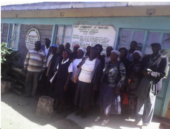
30 december 2014 MCH Finish werkt aan de gang 30th December 2014 MCH Finish works in progress