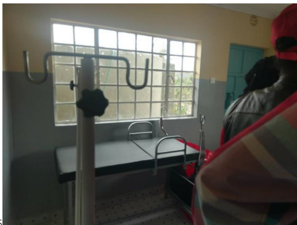
Afgerond en ingericht MCH Finalized and equipped MCH