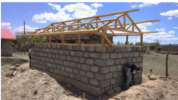
April 2015 - Eco-toilet in aanbouw April 2015 - Eco Toilets under construction