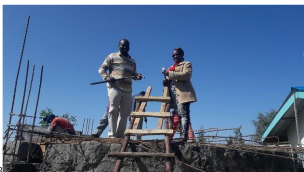
April 2015 - Watertank in aanbouw April 2015 - Water tank under construction