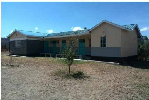
Februari 2017 - Watertank voltooid Feb 2017 - Water Tank Completed