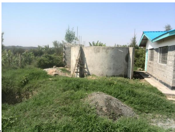
Februari 2017 - MCH voltooid Feb – 2017 – MCH completed