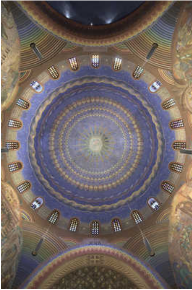
De paarsblauwe koepel van de Cenakelkerk.