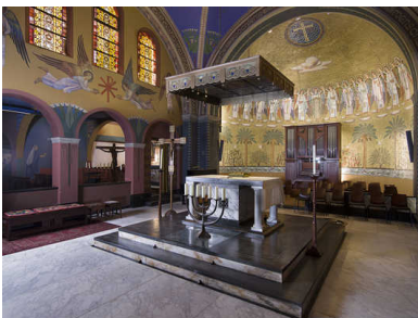
Op de muren zijn tal van bijbeltaferelen geschilderd.

erfgoed - reportage - Dertien religieuze gebouwen vormen samen het 'Grootste Museum van Nederland'. Eén daarvan is de 'oosterse' Cenakelkerk.