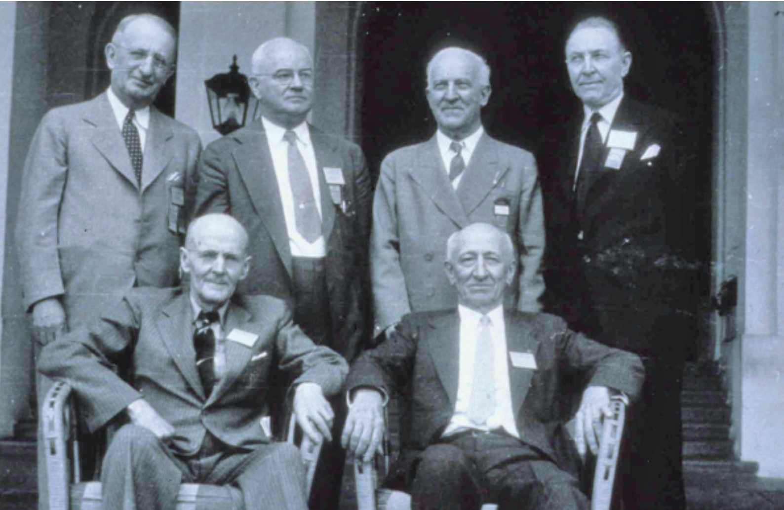
De eerste zes presidenten van Rotary International tijdens de Rotary conventie in 1939 in Cleveland, Ohio.