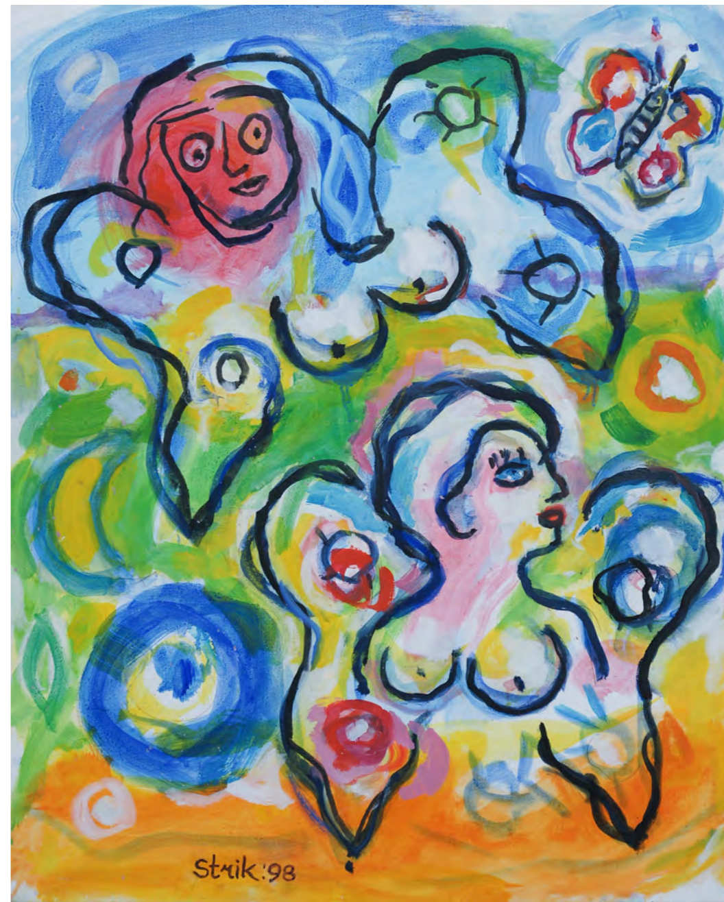
One night butterfly / 1998 / 100 x 80 cm