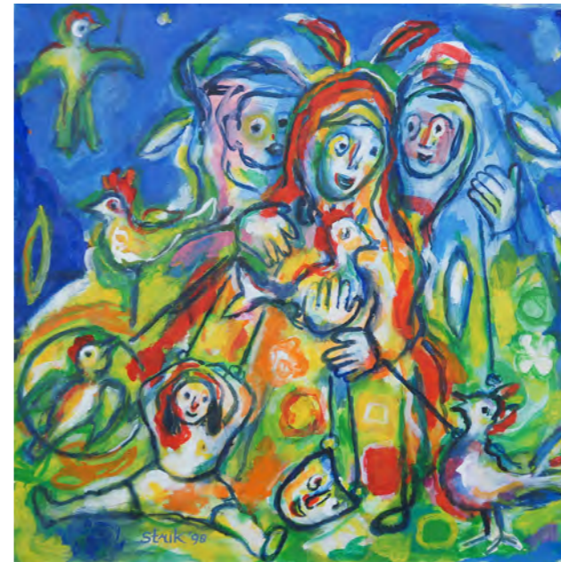
Bird control / 1998 / 90 x 90 cm