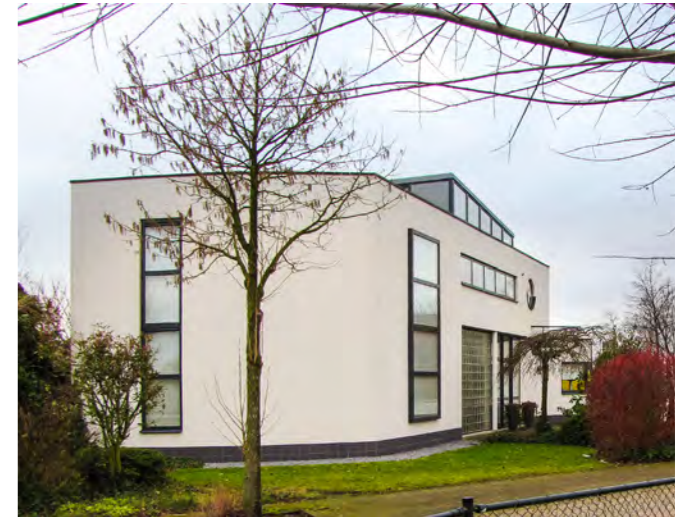
't Molenhuis xxx