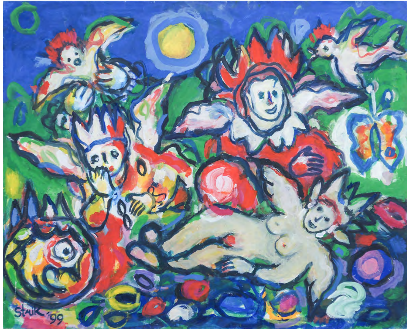
Indian summer / 1997 / ? cm