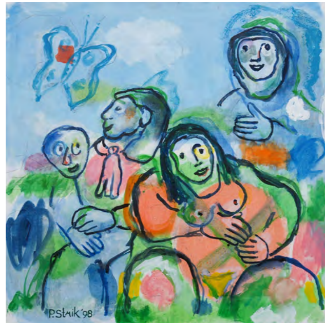
Family composition / 1998 / 90 x 90 cm