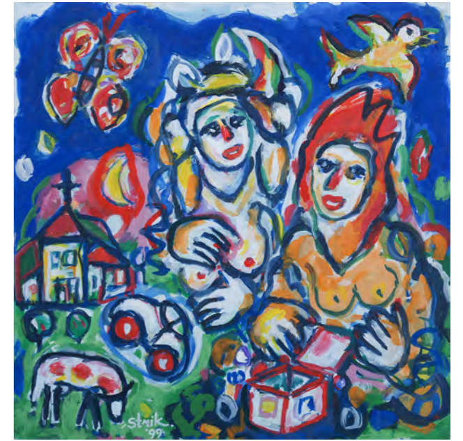
Box of Pandora / 1998 / 70 x 70 cm