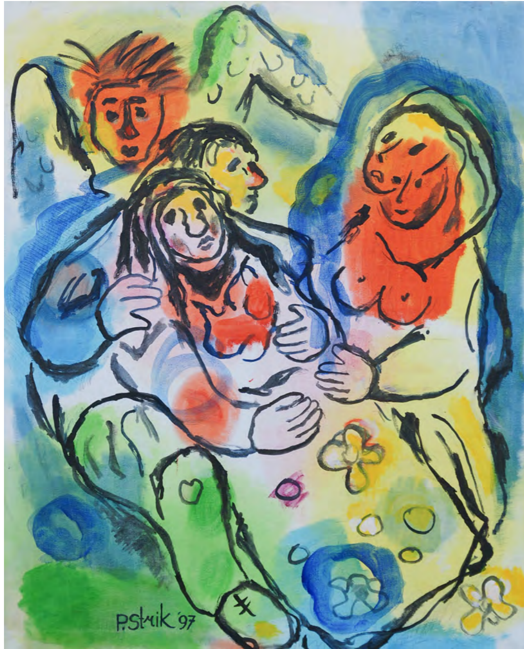
Let's take care of her / 1997 / 100 x 80 cm