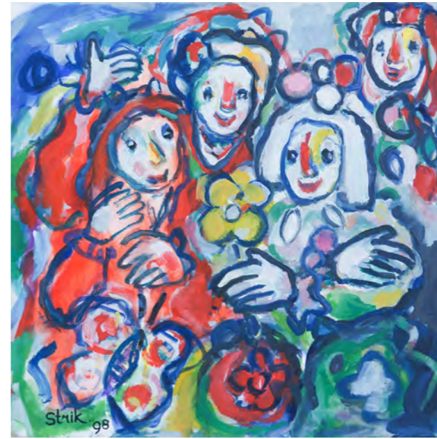
Just another sunday / 1998 / 70 x 70 cm