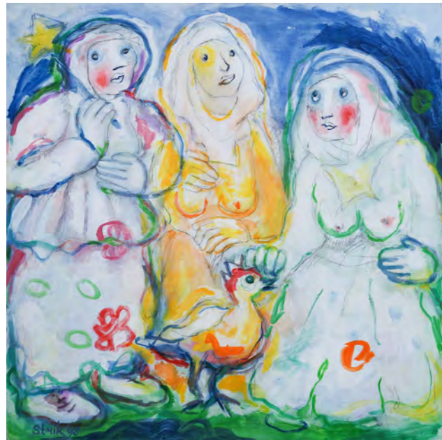
Family composition / 1998 / 90 x 90 cm