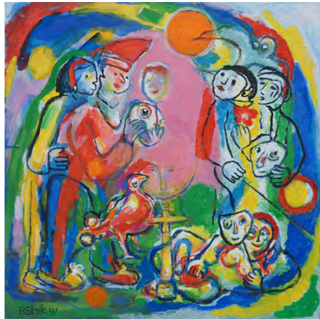
The mayor and his mirror / 1997 / 90 x 90 cm