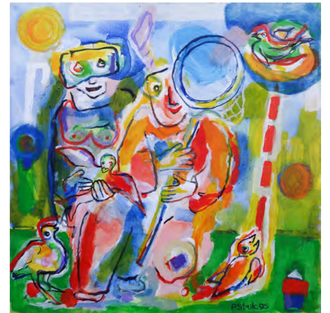
How to catch a flying bird / 1995 / 85 x 85 cm