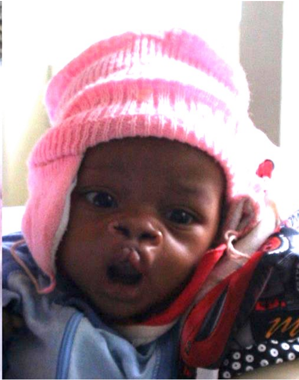
Marry, 3 maanden