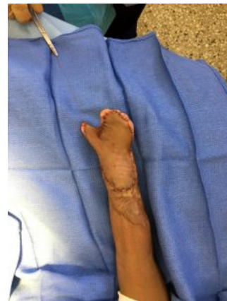
Hand van Shaloon