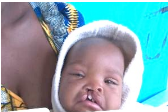
Chales, 1 jr. en 2 maanden

Dagelijks werd er op 2 operatietafels gewerkt door 3 plastische chirurgen. Gedurende deze 2 weken zijn bij kinderen en jong volwassenen 71 operaties uitgevoerd, vaak gecompliceerde en grote operaties.