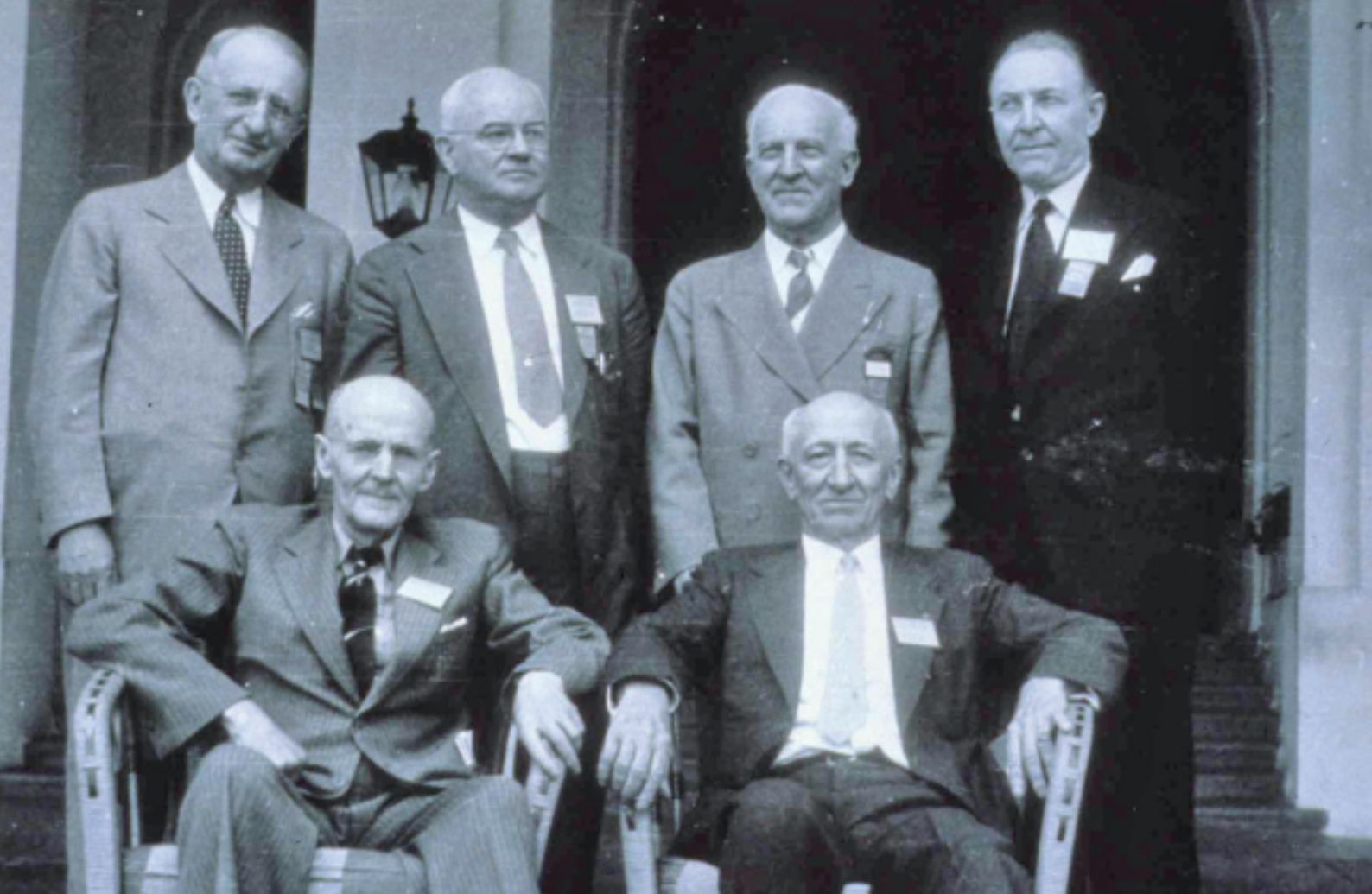
De eerste zes presidenten van Rotary International tijdens de Rotary conventie in 1939 in Cleveland, Ohio.