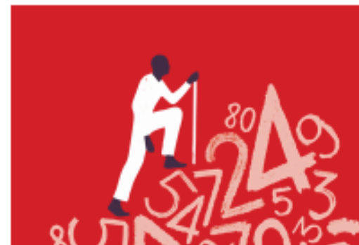
Je administratie op orde krijgen