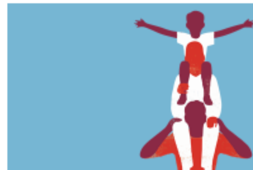
Opvoeden en ouderschap Home-Start en Home-start +