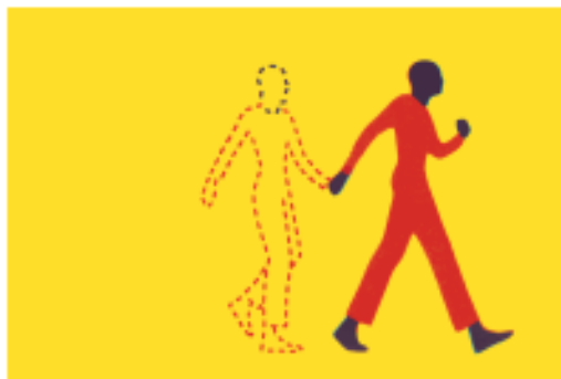
Omgaan met rouw en verlies Steun bij verlies