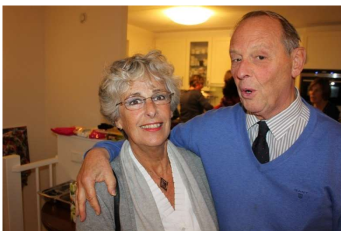
Deze foto is gemaakt tijdens het inloopdiner in november 2016.

Verder was Pam er altijd, wat we ook deden met de club. En altijd met een camera in zijn handen. De vele foto's die de club heeft komen dan ook grotendeels van hem. Zelden staat hij er zelf op, maar ik heb er eentje gevonden: