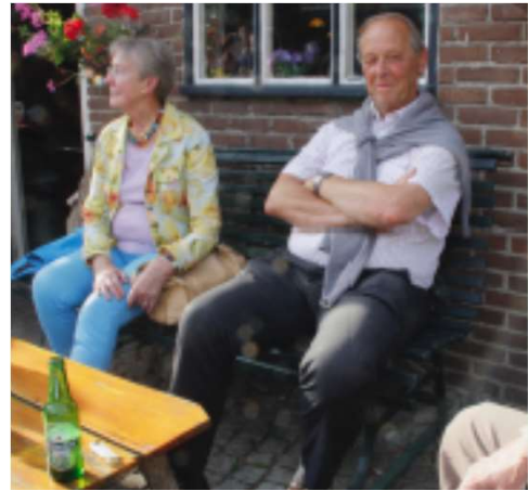
Een drankje na de rondleiding bij Boerderij 't Geertje in de zomer van 2014