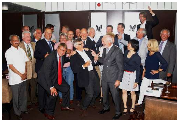
De foto spreekt voor zich.

Plezier maken met zijn vrienden en vriendinnen, dat was ook Rotary.