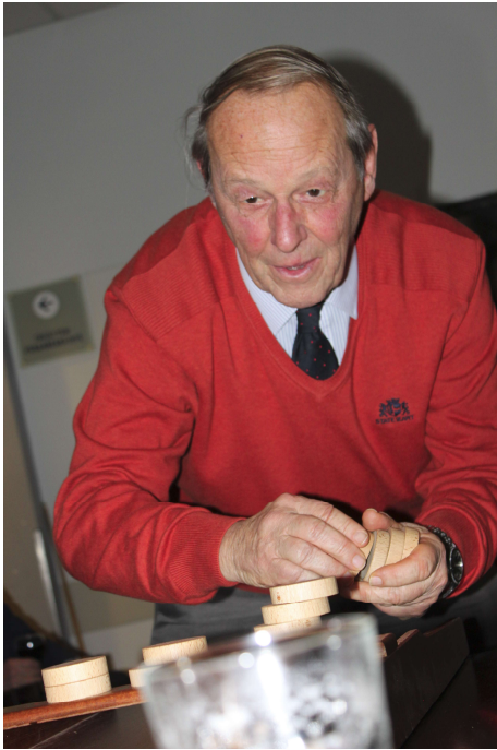
Spelletjesavond Heerensociëteit op 13 december 2016