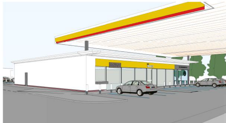
Park at Island_Option 3