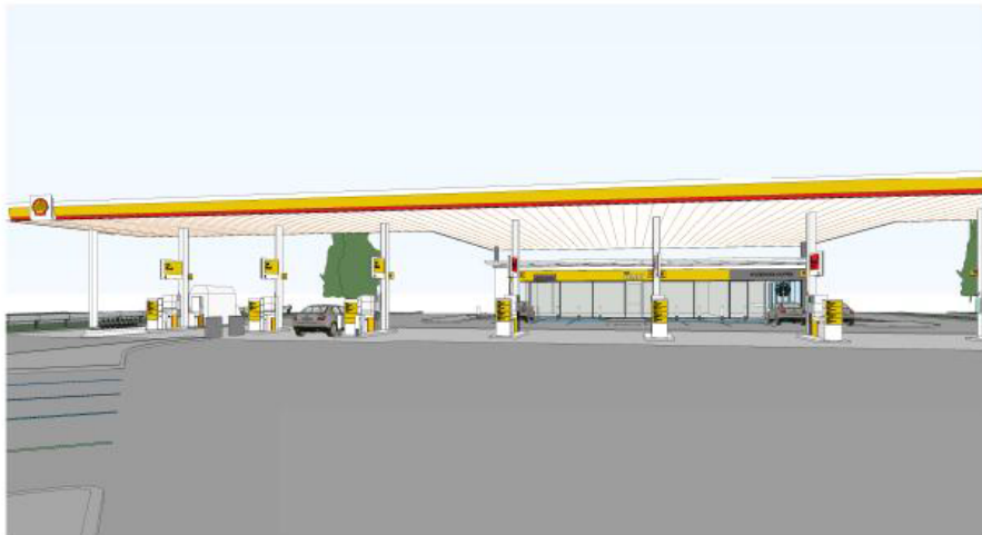
Choose Island_Option 3