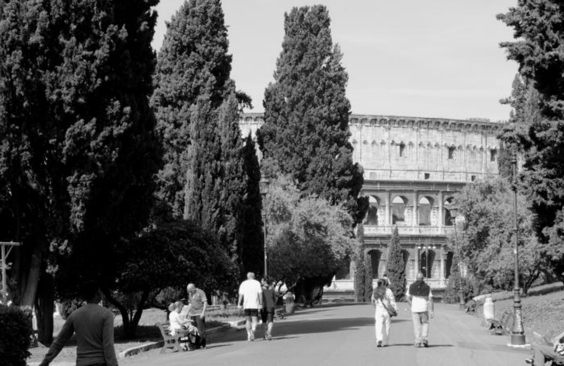
VIALE DELLA DOMUS AUREA