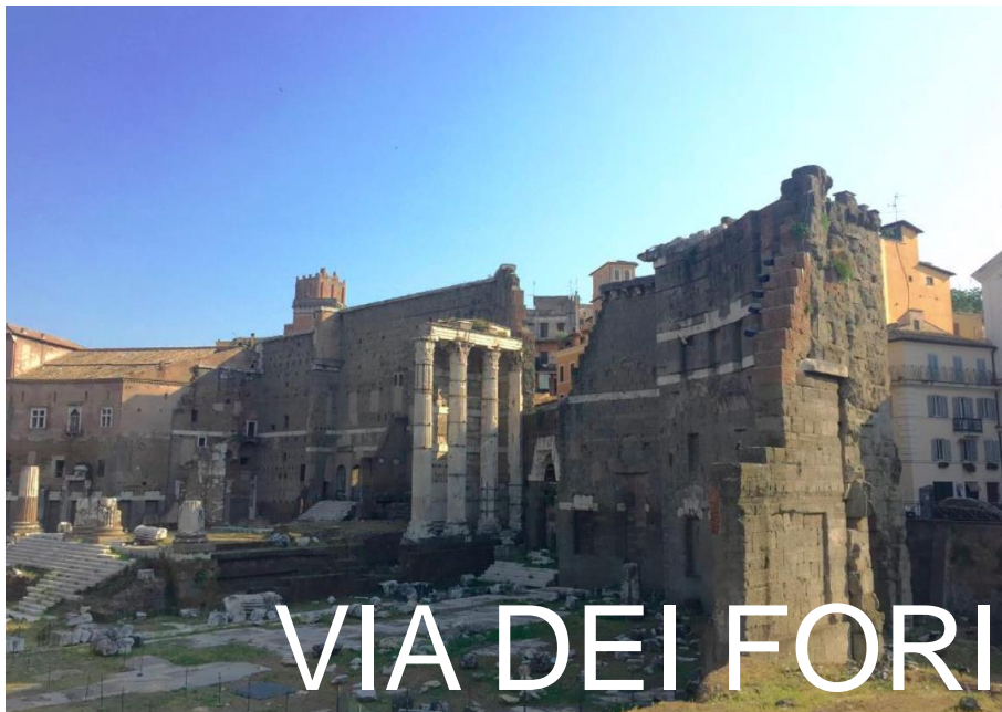
VIA DEI FORI IMPERIALI