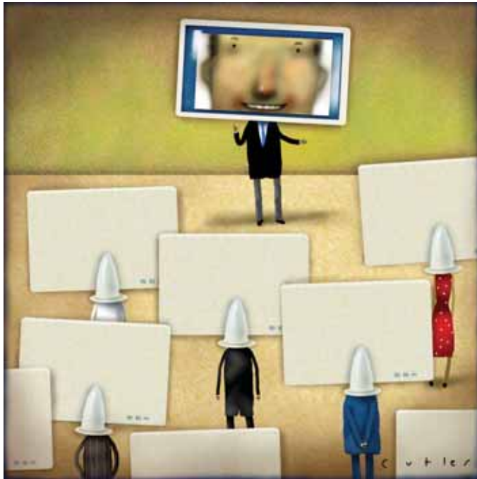
De essentie van het beroepspraatje vormt de wijze van uitoefening van het beroep, waarbij technische zaken en ethische en sociale aspecten aan de orde komen. (Illustratie: Cutler)

terrein kunnen ook in bevraging van een clublid, in de vorm van een rollenspel of middels een forum, aan de orde worden gesteld. Ook kan de club een onderwerp ter bespreking geven in de Avondjes van Zes (Fireside).